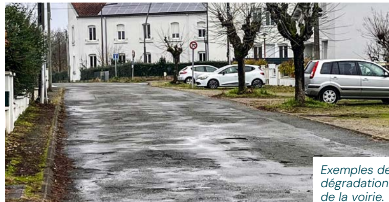
Exemples de dégradation de la voirie.