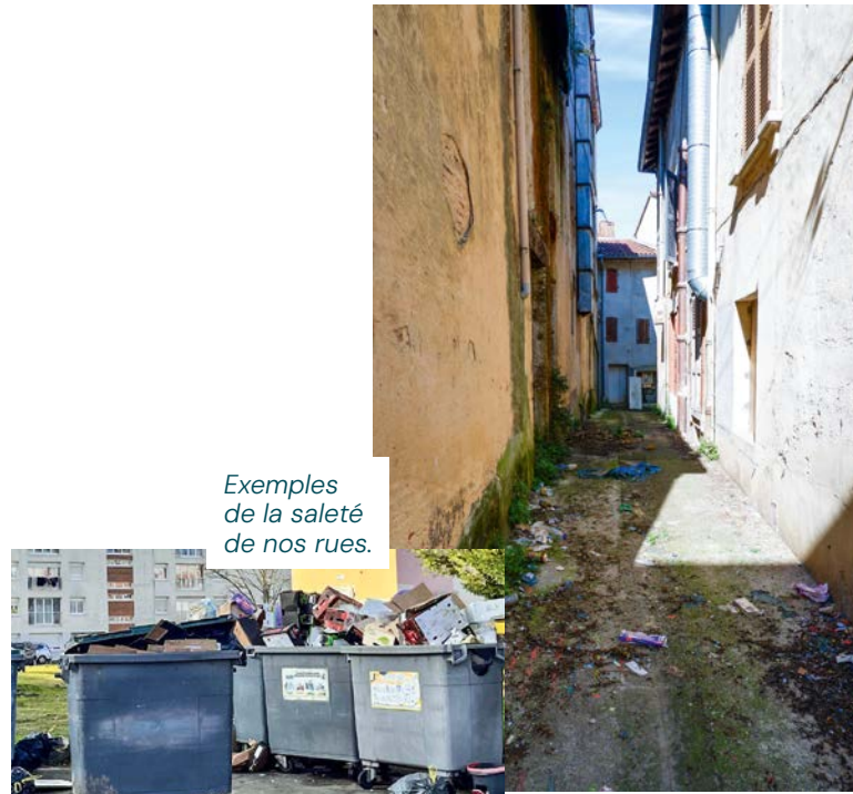
Exemples de la saleté de nos rues.