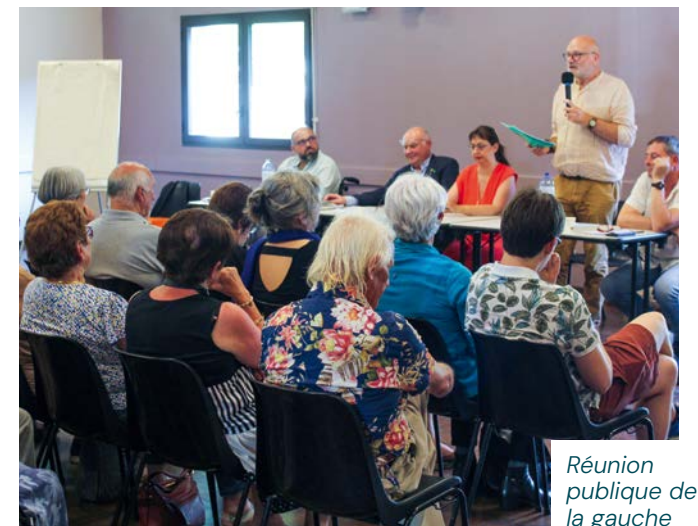
Réunion publique de la gauche unie (PS, PC, EELV, GRS, Place Publique)

« Construire ensemble une ville qui nous rassemble »