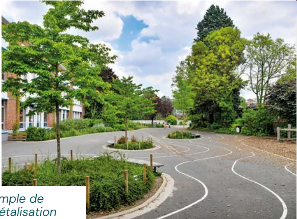
Exemple de végétalisation de cour d'école.

« L'école du Centre reste dégradée depuis si longtemps sans travaux sérieux »